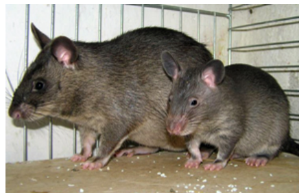
Ungerne fødes nøgne og vejer ca. 20 g ved fødslen. De fravænes som ca. 4 uger gamle, hvorefter de skal skilles fra moderen.