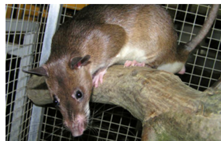
Hamsterrotter skal holdes i en voliere af kraftigt trådnet, så de ikke kan gnave sig ud. Begge arter er dygtige klatrere og skal altid have rigeligt forskellige klatremuligheder i form af grene, tovværk, hylder, rør og lignende. Derudover er et tykt bundlag, der giver gode gravemuligheder, vigtigt.

Kindposerne bruges til opbevaring og transport af føde og redemateriale.