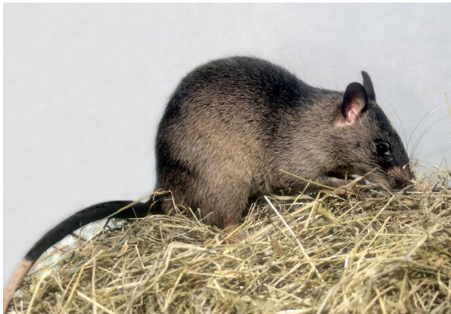
Gambiansk kæmperotte ( Cricetomys gambianus ) er den hamsterrotte-art, der hyppigst forekommer i privat hold i Danmark. Hamsterrotter er ikke nærtbeslægtede med hverken hamstere eller rotter.