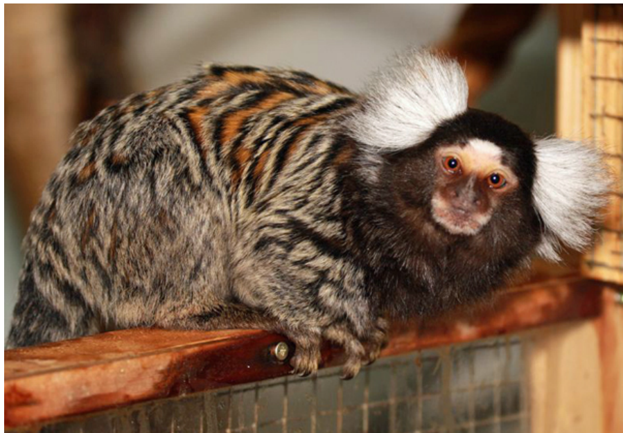
Hvidøret silkeabe ( Callithrix jacchus ) er en af de primatarter, der hyppigst ses i privat hold. Af alle primater er kun silkeaber lovligt at holde privat i Danmark.