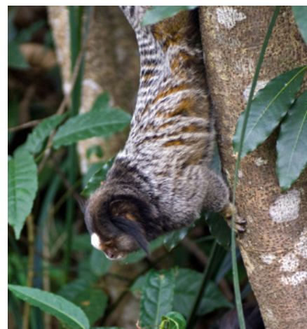
Silkeaber er trælevende og tilpasset til at bevæge sig rundt i træerne. Det er derfor meget vigtigt at indrette deres anlæg med rigeligt klatre- og springmuligheder i form af hylder, stammer, grene og tovværk i forskellige vinkler og niveauer.

Begge arter har specialiserede, korte hjørnetænder i undermundten, der med fortænderne bruges til at gnave huller i barken for at få adgang til plantesaft og gummi.