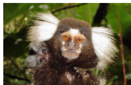
Faderen og ældre søskende hjælper i høj grad til med yngelplejen ved at bære rundt på ungerne, hjælpe dem med at finde føde og beskytte dem mod trusler.

Den er ligeledes den mest almindelige primat, der i dag findes i privat hold i Danmark, mens sortøret silkeabe er mere sjælden.