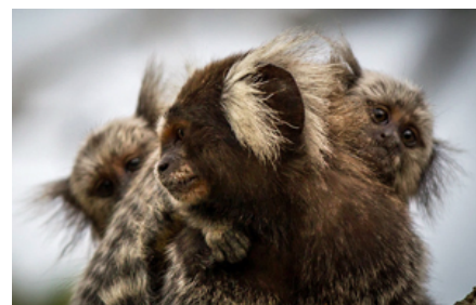
Disse silkeaber lever naturligt i familiegupper og er meget sociale dyr. De skal derfor altid holdes flere sammen, helst i naturlige familiegupper. Artsfæller kommunikerer især ved forskellige lyde, kropspositioner og ansigtsmimik.

Silkeaber har et stort behov for især D3-vitamin (findes bl.a. i nektar, pollen og vællingen), men også andre vitaminer og mineraler. Derfor skal der gives et vitamintilskud samt et kalk- og mineraltilskud, og vællingen er helt essentiel.